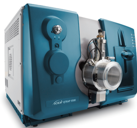
Triple Quad™ 4500 システム